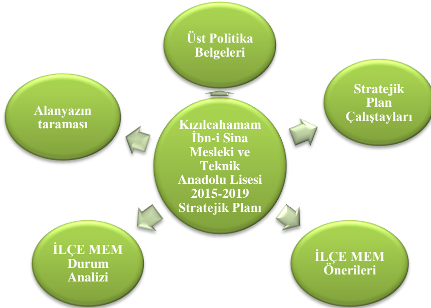
Şekil 1.Stratejik Plan Hazırlık Çalışmaları